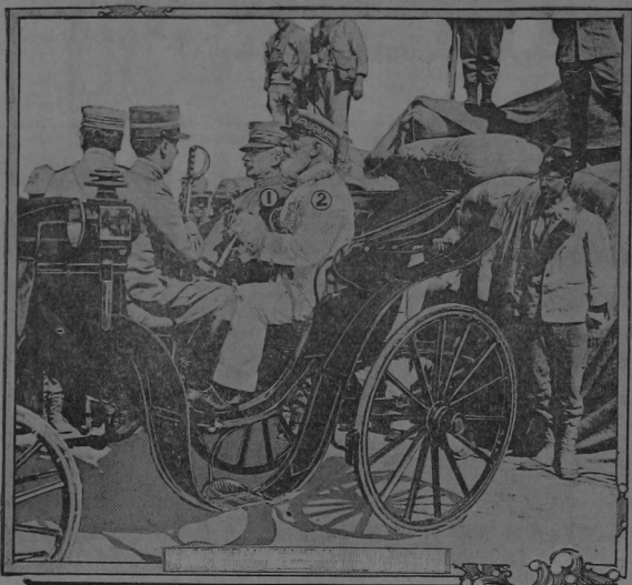
1.—General Caneva. 2.—Almirante Borea Rico D'Olimo

Para desvanecer los rumores de torturas y maltrato a los árabes en Trípoli, por las fuerzas italianas el General Caneva y el Almirante Rico D'Olimo han expedido un manifiesto relatando las atrocidades que los árabes cometen con los caráveres, los heridos y los miembros de la Cruz Roja del ejército italiano, que caen en su poder. Torturas, mutilaciones, de todo hacen los árabes; para evitar eso ha sido necesario fusilar a muchos de ellos sumariamente. No se ha fusilado ríno a los convictos y a los sorprendidos en flagrante delito de traición.