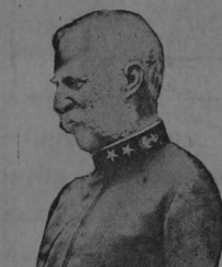
El Almirante Thomas

uno de los más brillantes jefes de la armada americana, está actualmente en aguas chinas abordo del acorazado «Oreón» y acompañado de varios cruceros. Estos buques unidos a los que antes había en los mares chinos, forman una poderosa escuadra.